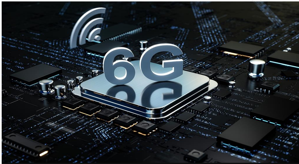
انځور ۳: د G6 مخابراتي ټکنالوژۍ په برخه کې د چین نوی پرمختګ

د چین هېواد څخه ورسته د آی اېم ټي پرموشن ګروپ (IMT-2030 Promotion Group) له لارې د G6 پر څېړنو کار کوي، دغه ډله د مخابراتي شرکتونو، تخنیکي تجهیزاتو جوړونکو، پوهنتونونو، او څېړنیزو مرکزونو ګډه صنعتي ټولنه ده. دا نوې آزمایشي جوازونه د G5 شبکو تر بریالي پلي کېدو او د G-Advanced 5 پرمختللو خدماتو وروسته، د چین لپاره یو بل مهم پرمختګ بلل کېږي. [3]