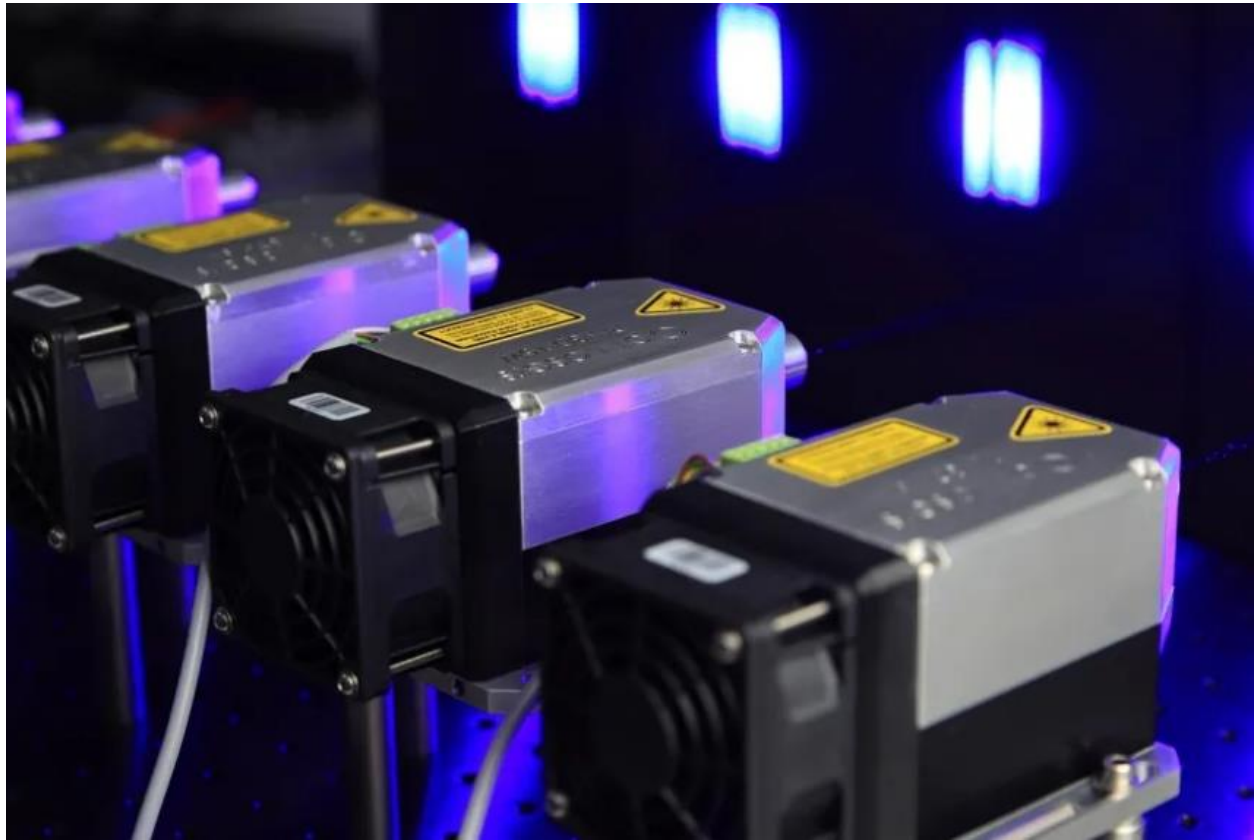
انځور ۴: د اوبولاندې لېزري لید نوې ټکنالوجی

د اوبولاندې د لېزري لید اُنډرو اټر لېزروېژن (Underwater Laser Vision) نوې ټکنالوجی د سمندر د تل د څېړنې بڼه بدلوي، او د دې بدلون مهمه برخه اُنډرو اټر لایډار (Underwater LiDAR) ټکنالوجی ده. دغه پرمختللی سیستم د سینګل فوتون لېزرز (Single-Photon Lasers) او چټکو درې بعدی تری ډي سکېنز (3D Scans) په مرسته کار کوي. د دې ټکنالوجی په وسیله ساینسپوهان او څېړونکي کولای شي په خړو او تورو اوبو کې هم روښانه انځورونه ترلاسه کړي؛ هغه ځایونه چې هلته د انسان سترګې، عادي کامرې، او ځینې دودیز سپنسرز (Sensors) سم کار نه شي کولای. د پخوانیو مهمو او ناڅرګندو انځورونو پر ځای، دغه سیستم ډېر دقیق او اندازه کونکي دی چې د درې بعدی تری ډي ماډلز (3D Models) جوړوي. دا ماډلونه وروسته هم تحلیل کېدای شي او د سمندري څېړنو، پوځي عملیاتو، د ډوبو شویو بېړیو موندلو، او چاپیریالي څارنې لپاره مهم معلومات برابروي. کارپوهان وایي چې اُنډرو اټر لایډار (Underwater LiDAR) د سمندر د ژورو سیمو د نقشو جوړولو او د اوبولاندې د پتو شیانو د موندلو په برخه کې یو لوی تخنیکي انقلاب بلل کېږي. [۴]