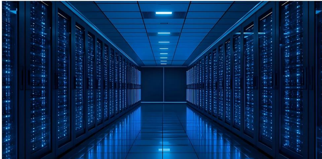
انځور ۲: د مصنوعي ځيرکتيا د زېرناوونه کاربنه او مالي زيانونه

د لوران گيل (Laurent Gil) چې د Cast AI رئيس دی، ويلي: "دا موضوع موږ او زموږ پېرېدونکي دواړه حيران کړل، ځکه نږدې هېچا نه پوهېدل چې دوی له دغو ماشينونو سمه استفاده نه کوي." [۲]