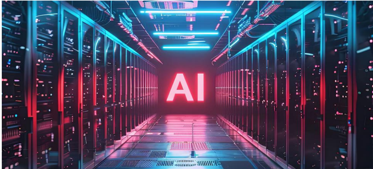
انځور ۱: د مصنوعي ځيرکتيا اغېزې او د عايداتو نابرابري

د ۲۰۲۶ کال د فبرورۍ يوې څېړنې، چې د نېشنل بيورو اف اکنامیک ريسرچ (National Bureau of Economic Research) له خوا خپره شوې، ښودلې چې ۹۰٪ شرکتونو لا تر اوسه د AI له کارولو څخه د توليد يا فعاليت څرګند پرمختګ نه دی ثبت کړی. يعنې پانګه وال لا دمخه د سهمونو له لارې کټه ترلاسه کوي، خو د کار په چاپېريال کې عملي بدلونونه لا نه دي بشپړ شوي. [1]